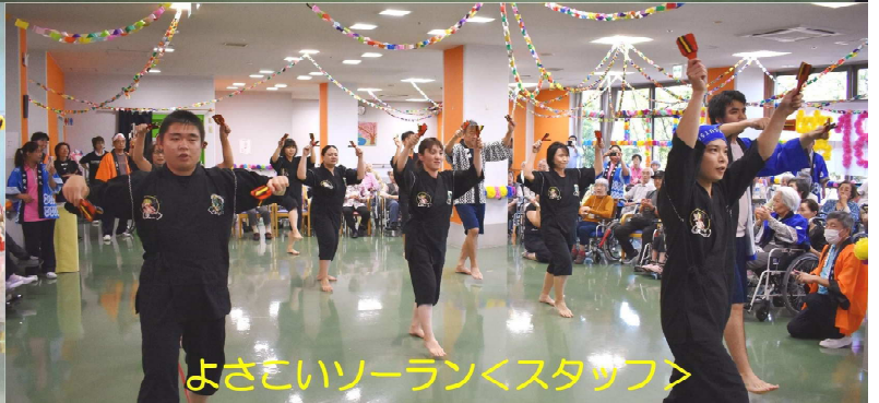
よさこいソーラン<スタッフ>

今回は、盆踊りなどイベントも、屋台の食事も、ゆっくり楽しんでいただこうと前後半2部制で行いました。