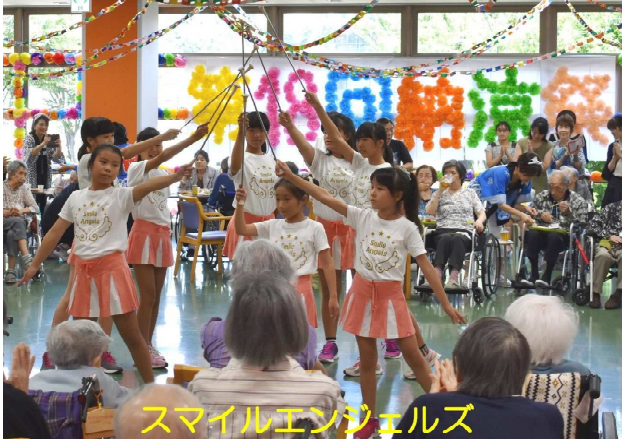
スマイルエンジェルズ